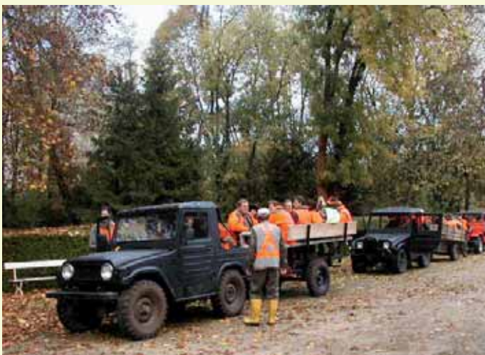
Abfahrt in den Wald