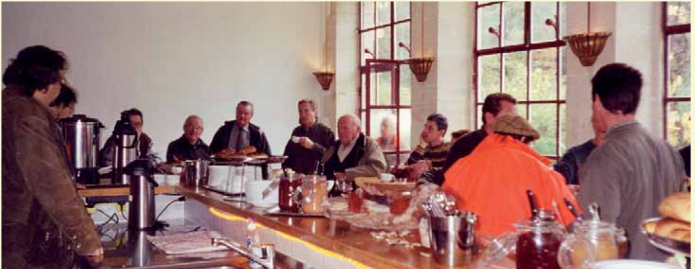
Frühstück in der Orangerie