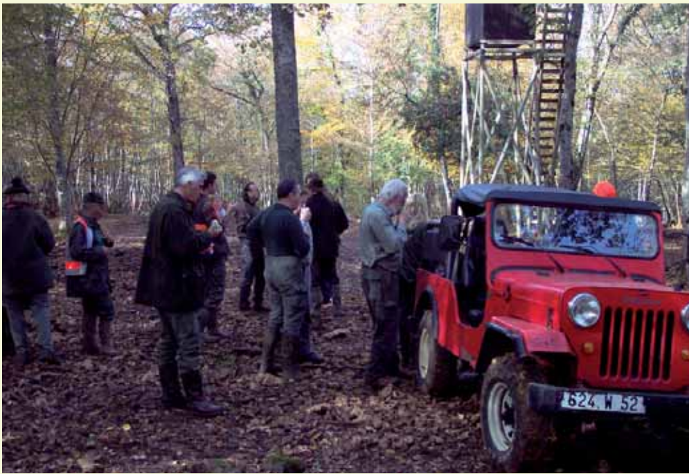
Jagdpausen im Wald oder am prasselnden Kamin im Schlosskeller