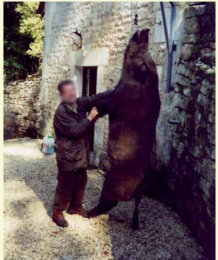
Der bisher stärkste Keiler mit 240 kg